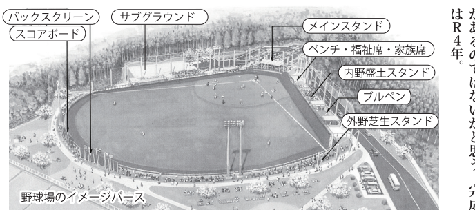
野球場のイメージパース

バックスクリーン スコアボード サブグラウンド メインスタンド ベンチ・福祉席・家族席 内野観客スタンド プルベン 外野芝生スタンド